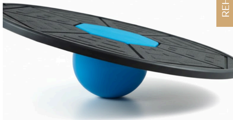
Tabla Propioceptiva, Disco de Equilibrio o Wobble Board