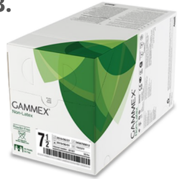
Neopreno estéril sin polvo